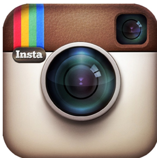
Fig. 1. Logo di Instagram ( http://bit.ly/1VvkrUT )