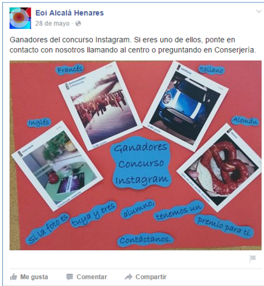
Foto n 4 Il tabellone con le foto vincitrici esposto a scuola e pubblicato sul web ( http://on.fb.me/1iUlfkq )

Naturalmente, l'attività poteva e può essere migliorata, ma abbiamo comunque apprezzato il fatto che abbia aiutato gli studenti a sviluppare la propria consapevolezza lessicale, ad avvicinarsi alle reti sociali in quanto strumenti di apprendimento collettivo e a riflettere sulla competenza plurilinguistica e multilinguistica (un solo utente poteva postare scatti che riguardavano tutte le lingue che aveva studiato o che riflettevano più di una cultura/lingua in un'unica foto). Infine, la prospettiva ludica, basata sulla gamification (il premio finale come incentivo) è stata un'ulteriore carta vincente che ha permesso agli alunni delle lingue insegnate alla EOI di Alcalá di interagire sia tra di loro che con l'account della scuola, favorendo una maggiore coesione e un più stretto senso di appartenenza al gruppo. Il concorso è servito anche e soprattutto per far sì che gli studenti usassero Instagram per interagire con la Scuola: un'alunna, per esempio, ha pubblicato foto di un'attività prevista per la Giornata Open Day con gli hashtag #eoiocalaitaliano ed #eoiocalafrances .