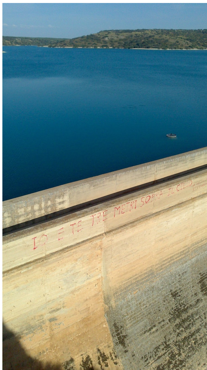
Foto n 2 #MoccianellaMancia!: Lago manchego con la scritta tratta dal film "Tre metri sopra il cielo" di Luca Lucini ( https://instagram.com/p/zqCTtQwth-/ )